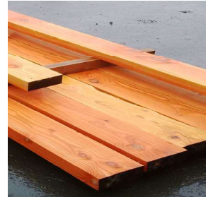
PLANCHE BRUT DOUGLAS (REP:020601100)